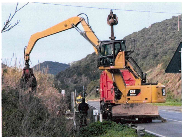
Attività dalla SS. 126

Alle ore 14.56 l'allerta rosso veniva prorogata dalle ore 23.59 del 19/01/2026 alle ore 23.59 del 20/01/2026.