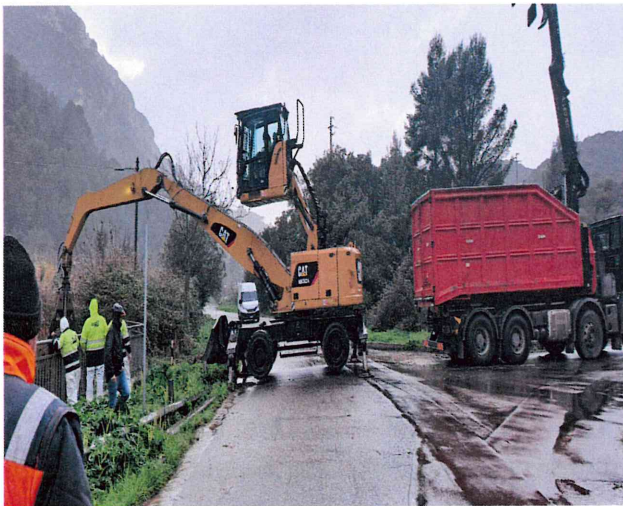
Posizionamento macchina operatrice