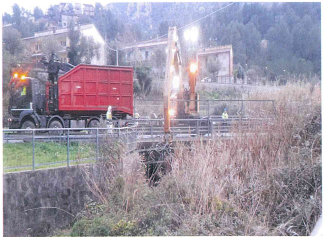
Attività dalla SS. 126