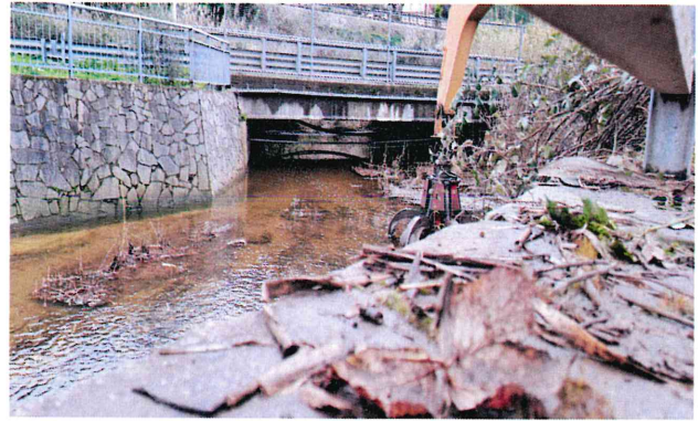
Proseguo attività a monte del ponte