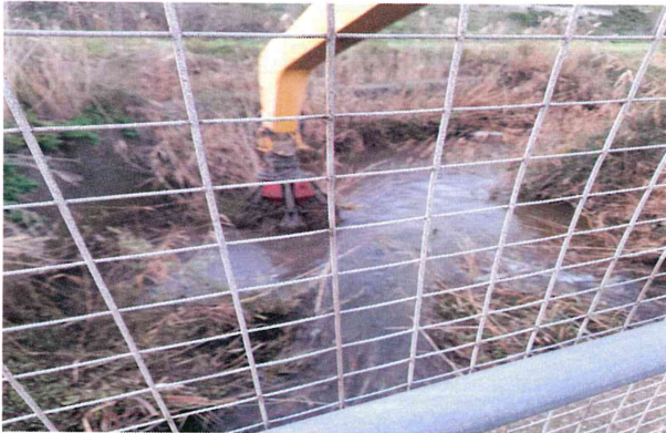
Attività a valle del ponte