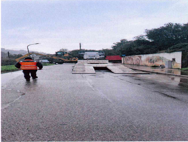
Trasporto della macchina operatrice