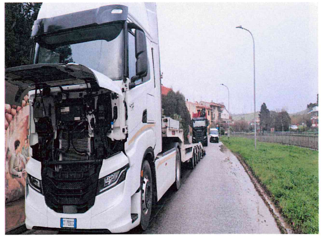
Motrice + Cassone