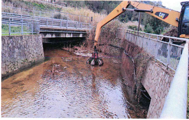
Proseguo attività a monte del ponte