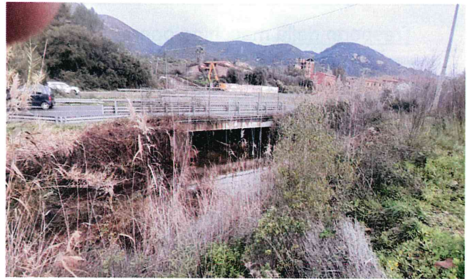
Attività a valle del ponte

L'intervento relativo al Rio S. Giorgio è stato eseguito in parte nel pomeriggio e serata del 20/01/2026 e nella giornata del 21/01/2026 durante le quali è stato rimossa la parte più importante dei detriti presenti a monte del ponte sulla SS. 126 e successivamente nella giornata del 27/01/2026 durante la quale si è intervenuti per rimuovere la restante parte dei detriti presenti a valle del medesimo ponte.