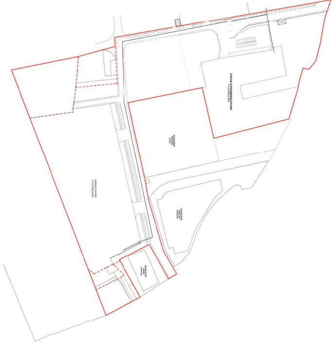
PLANIMETRIA GENERALE RETE TELECOMUNICAZIONI SCALA 1:1000