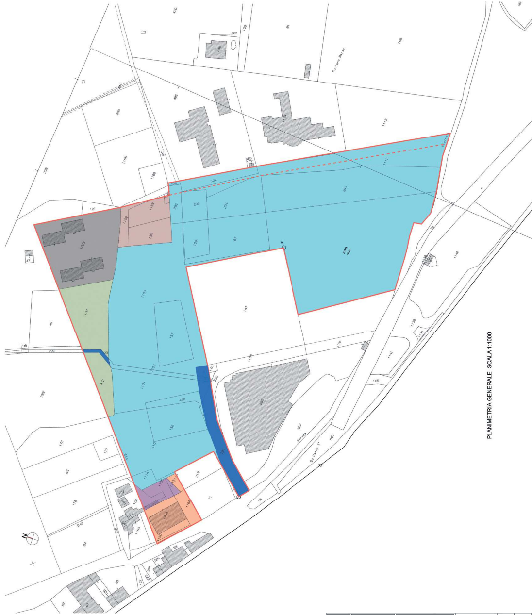
PLANIMETRIA GENERALE - SCALA 1:1000